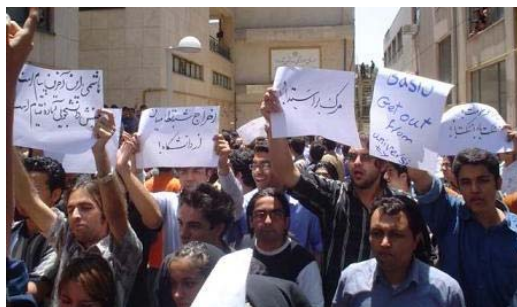
صحنه ای از اعتراض دانشجویان تهران در آستانه مضحکه انتخاباتی