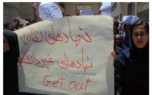
عکسی از اعتراض دانشجویان تهران در هفته گذشته

اسلامی تبدیل کنیم! تشکیلات خارج کشور حزب کمونیست کارگری ایران ژوئن ۲۰۰۵ - ۱۱ خرداد ۱۳۸۴