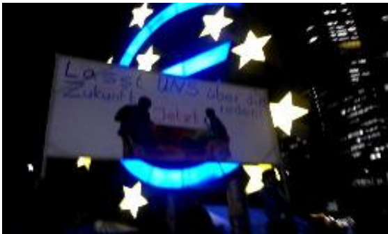
عکس هایی از تظاهرات ۱۸۰۰۰ نفره در فرانکفورت

جنبش مجمع عمومی مردم و رای مردم گذاشته است و در والستریت تا سطح پلاتفرمی با ساختار شورایی جلو رفته است. روشن است که این جنبش فراز و نشیب های خود را دارد، ممکن است مورد حمله قرار گیرد و در مقطعی عقب نشیند. اما قطعاً با شفافیت و گستردگی و عمق بیشتر دوباره سر بلند میکند. بخاطر اینکه این جنبش در همین مدت نیروی جهانی خود را دیده و تجربه کرده است و روی مسائل و خواستهها و معضلاتی انگشت گذارده که بدون تحولاتی عمیق حل شدنی نیست.*