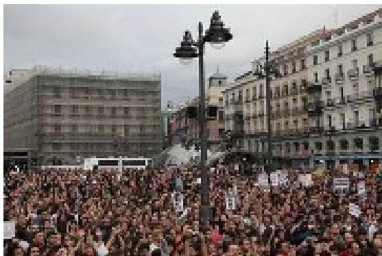
تظاهرات هزاران نفره مردم در یونان