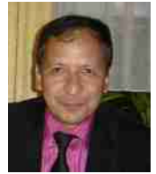
بهروز مهر آبادی

که سرمنشأ این اتفاقات و اقدام ها بودند، مورد تعقیب قرار نگرفته اند، افرادی که مورد تعقیب قرار گرفته اند کسانی هستند که یا مامور بودند و کسان دیگری به آنها امر می کردند و یا مجازات هایی که برای آنها تعیین شده منطبق با اقدام ها و اعمالی که انجام داده اند، نیست. پیگیری خانواده های قربانیان جنایات کهریزک که برخی از آنها از نزدیکان رژیم بودند، برای تعقیب آمران و عاملان اصلی ادامه یافت. خانواده ها خواهان محاکمه عاملان اصلی از جمله سعید مرتضوی شدند و انتصاب سعید مرتضوی به ریاست ستاد مبارزه با قاچاق کالا و ارز اعتراضات زیادی را برانگیخت. او علاوه بر کهریزک بعنوان قاضی دادگاه امنیتی تهران، دادگاه مطبوعات و دادستان تهران ارتکاب جنایات متعددی را در پرونده خود دارد. او از طرف دولت کانادا یکی از مجرمین اصلی قتل زهرا کاظمی معرفی شده است.