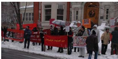
اکسیون برای آزادی دانشجویان دستگیر شده در مقابل سفارت جمهوری اسلامی در اتاوا ص ۷