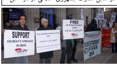
برای آزادی دانشجویان دستگیر شده-لندن